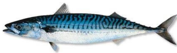
Die Schützengilde Eisingen

Bei schönem Wetter sitzen wir im Freien, bei schlechten Wetter im Schützenhaus.