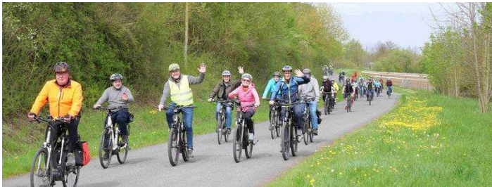
Landrat Thomas Eberth lädt am Samstag, 27. April 2024 alle fahrradbegeisterten Bürgerinnen und Bürger des Landkreises Würzburg zur Fahrradtour ein.

Landrat Thomas Eberth lädt am Samstag, 27. April 2024 alle fahrradbegeisterten Bürgerinnen und Bürger des Landkreises Würzburg zur Fahrradtour ein.