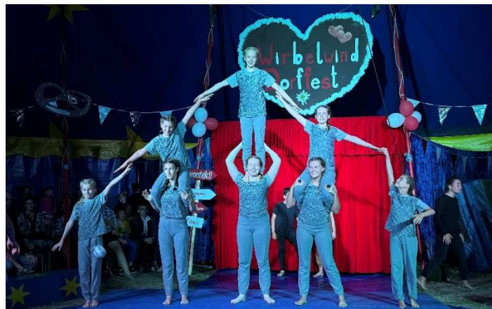
Teamwork in der Manege: Mädchen unterschiedlichen Alters stu- dierten 2025 beim Circus Wirbelwind in Neubrunn gemeinsam eine Nummer ein.

Die Anmeldung ist ab dem 15. Januar 2026 über das Por- tal www.jugend-landkreis-wue.de (Stichwort: Jahrespro- gramm) möglich. Die Plätze werden nach Eingangsdatum vergeben. Für weitere Informationen steht die Kommunale Jugendarbeit des Landkreises Würzburg gerne zur Verfü- gung (Tel: 0931 8003-5842, E-Mail: jahresprogramm@ira- wue.bayern.de ).