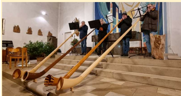
Alphornpower Rottenbauer