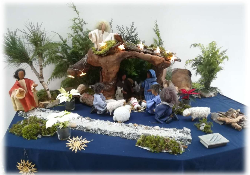
Krippe in der Philippuskirche