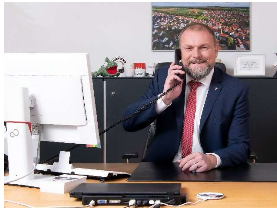
Landrat Thomas Eberth ist künftig für die Bürgerinnen und Bürger des Landkreises Würzburg in einer digitalen Sprechstunde per Telefon und Videokonferenz erreichbar.

Mit der Einführung der digitalen Bürgersprechstunde reagiert das Landratsamt Würzburg auf den wachsenden Bedarf an flexiblen und barrierearmen Kommunikationswegen. Bewusst wird dabei auf eine klassische Präsenzsprechstunde verzichtet, um Bürgerinnen und Bürgern unabhängig von Wohnort, Mobilität oder zeitlichem Aufwand den direkten Zugang zur Verwaltung zu erleichtern und ihnen eine einfache Möglichkeit zu geben, Fragen und Anliegen unmittelbar mit Landrat Thomas Eberth zu besprechen. Weitere Termine werden regelmäßig auf der Webseite www.landkreis-wuerzburg.de veröffentlicht.