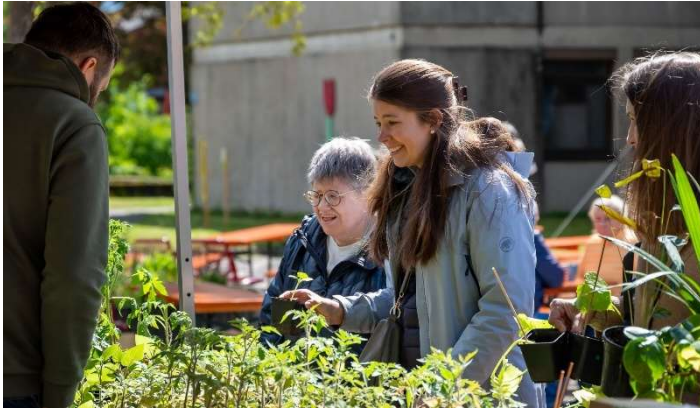
Begegnung auf Augenhöhe: Besucher:innen erlebten echte Inklusion beim Stiftsfest an verschiedenen Verkaufs- und Mitmachständen auf dem Gelände des St. Josefs-Stift Eisingen.