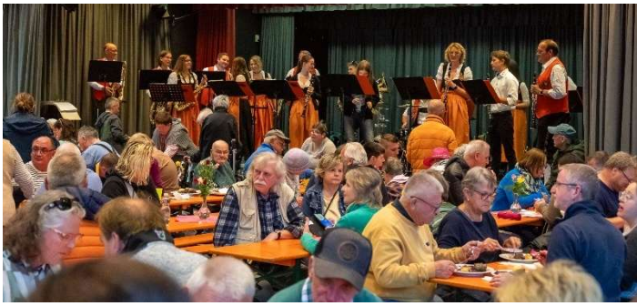
Musik und Begegnung im Theatersaal: Die Eisinger Blaskapelle sorgte beim Stiftsfest für musikalische Stimmung und begleitete den Festtag mit einem vielfältigen Programm.