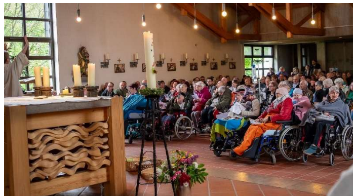
Gemeinsam feiern und Gemeinschaft erleben: Der ökumenische Gottesdienst eröffnete traditionell das Stiftsfest 2026 im St. Josefs-Stift Eisingen. Zahlreiche Bewohner:innen, Angehörige und Gäste aus der Region kamen dafür in der Kirche zusammen.

Das Stiftsfest findet traditionell an Christi Himmelfahrt statt und ist seit vielen Jahren ein fester Bestandteil im Veranstaltungskalender der Region. Es steht für Offenheit, Vielfalt und ein Miteinander, bei dem Menschen mit und ohne Behinderung gemeinsam feiern und Zeit verbringen.